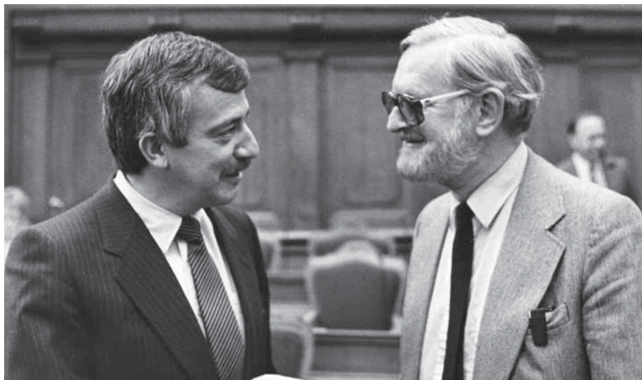
Socialdemokratiets udenrigspolitiske ordfører, Lasse Budtz, i samtale i Folketinget med en af sine hovedmodstandere under ”fodnoteperioden”, udenrigsminister Uffe Ellemann-Jensen fra Venstre. Trods de venlige miner var forholdet mellem de to anstrengt. Kritikere af fodnoterne mente, at Socialdemokratiet bl.a. lod sig påvirke af Sovjetunionens fredsudspil, og at delegationsrejsen til Moskva i 1984 var udtryk for eftergivenhed over for fjenden.

Debatten giver anledning til nærmere at undersøge en række spørgsmål om PET's rolle i forbindelse med det socialdemokratiske besøg i Moskva i 1984: Hvilke oplysninger indsamlede PET om rejsen, og hvilket billede giver de af Socialdemokratiets forhold til Sovjetunionen på dette tidspunkt? Hvordan vurderede PET rejsen efterretningsmæssigt? Og blev de tre ledende socialdemokrater registreret i PET? Det skal understreges, at undersøgelsen fokuserer på PET's rolle; der vil derfor ikke blive taget nærmere stilling til, om Socialdemokratiets politik bidrog til at svække den danske sikkerhedspolitik overfor østblokken, eller om delegationsmedlemmernes udtalelser om rejsens resultater var misvisende.