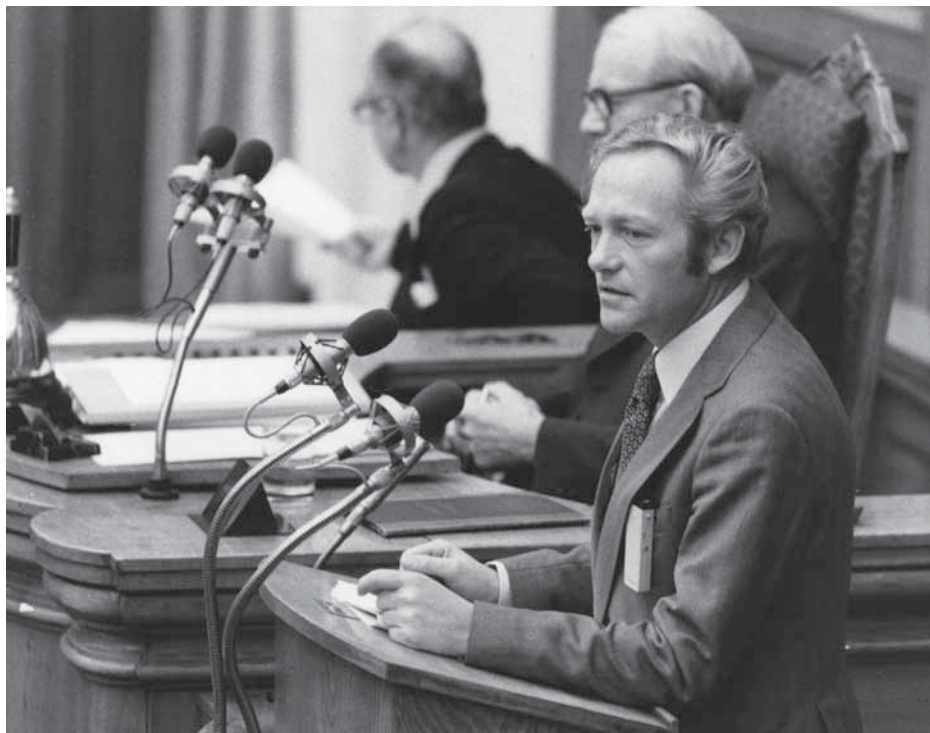
Den politiske ordfører for Socialdemokratiet, Ole Espersen, under Folketingets åbningsdebat i november 1979. Espersen havde kontakter til sovjetiske og nordkoreanske diplomater, der var efterretnings-officerer, og han blev derfor af PET's ledelse anset for at udgøre en sikkerhedsrisiko. Dette forhold prægede hans embedsperiode som justitsminister fra 1981 til 1982. Han blev således ikke orienteret om Gordijevskij-operationen eller anholdelsen af forfatteren Arne Herløv Petersen.

Samtidig modtog PET oplysninger fra Gordijevskij om KGB's planer med den socialdemokratiske politiker, som må have bestyrket tjenestens eventuelle mistanke mod ham. Ifølge Gordijevskij havde KGB i mindst tre år haft som mål at rekruttere Espersen. Han blev anset for en betydningsfuld og indflydelsesrig politiker med en lovende karriere foran sig, og han mentes at tilhøre partiets venstrefløj. Sovjetiske ledere, der havde mødt Espersen, var imponerede over ham. Espersen fik tildelt dæknavnet Ervin , og residenturet besluttede at studere ham med henblik på at afgøre, om han skulle godkendes som en kontakt under dybt studium med henblik på hvervning ("objekt rasrabotki"). Residenturet ønskede at bruge Espersen til at indhente politiske efterretninger, men officererne havde i flere år svært ved at etablere en kontakt, da danskeren var optaget af sine gøremål som radiorådsformand, professor i jura ved Københavns Universitet,